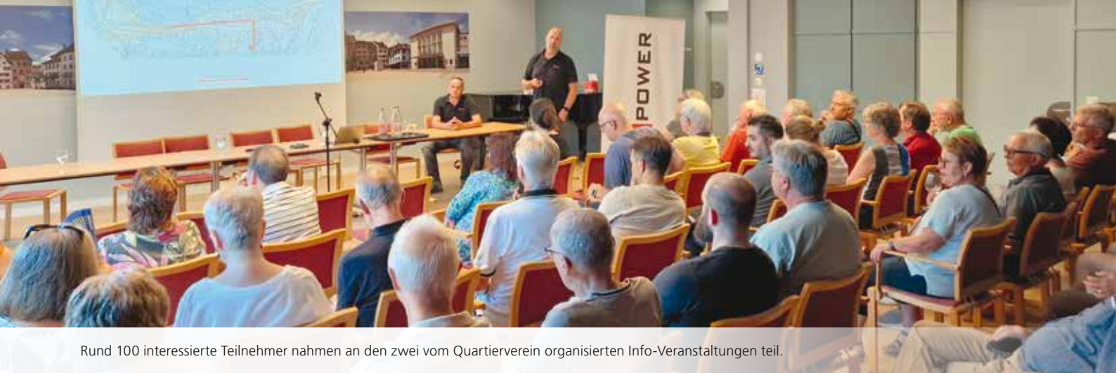
Rund 100 interessierte Teilnehmer nahmen an den zwei vom Quartierverein organisierten Info-Veranstaltungen teil.