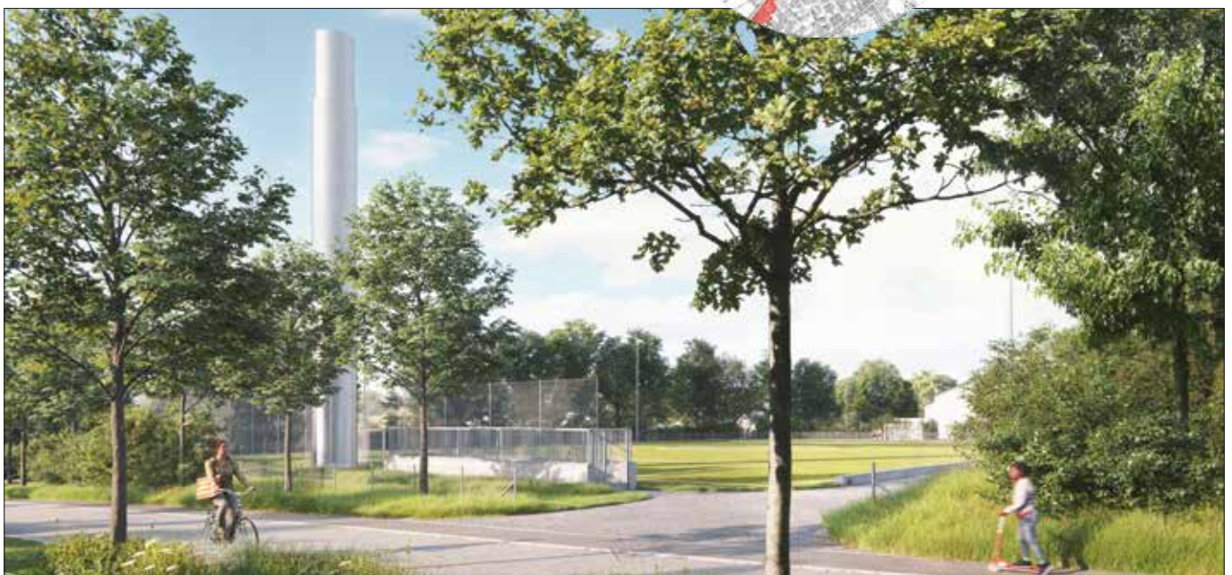
Visualisierung der geplanten Anlage