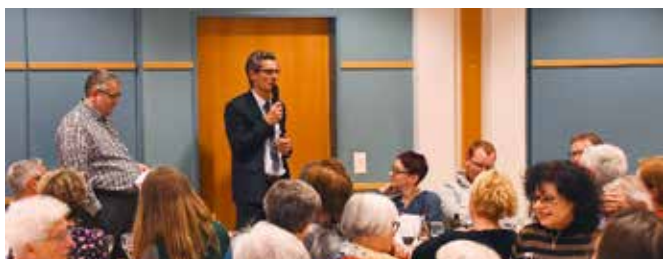
Generalversammlung des Quartiervereins im «La Résidence»