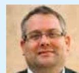
Christian Stamm Medien, Verkehr, Bau