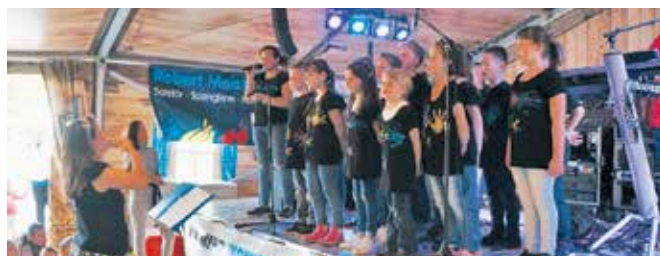
Dorffest 2019 mit Kinder-Nachmittagsprogramm auf der Chilbiwiese