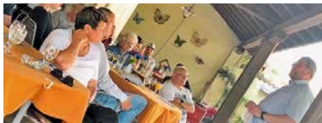
Neuzuzüger- & Neumitglieder-Anlass 2019 im Garten des Quartier-Restaurants Adler