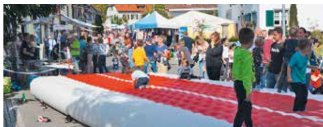
41. Chilbi der Herblinger Vereine auf der Schlossstrasse