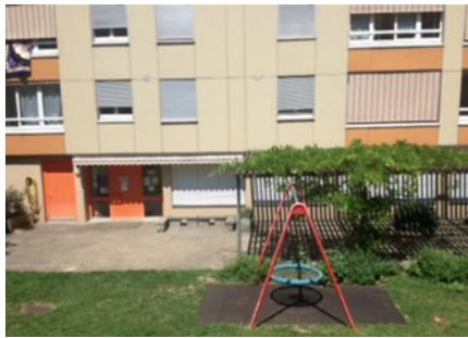
Blick auf die Räume Neutalstrasse 16 und 18

Die Quartierentwicklung Stadt Schaffhausen öffnet an mehreren Tagen die Räume Neutalstrasse 16 & 18 für die Bevölkerung. An diesen Mitdenk-Anlässen wollen wir Ihre Ideen & Anliegen für mögliche Nutzungen der Räume sammeln. Sie können