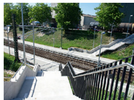
Der Haltepunkt Herblingen neben dem neuen Lipo Park heute.