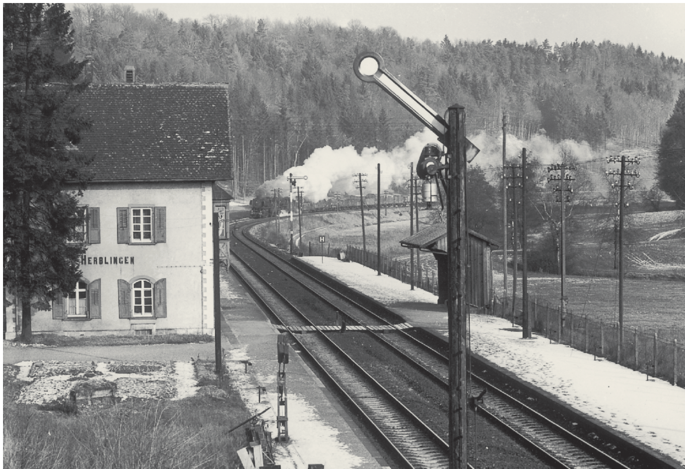
Dampfzug der Deutschen Bahn beim Bahnhof Herblingen im Jahre 1964.

Herblingen beendet. Der letzte Zug, gezogen von einer Dampflokomotive, hielt kurz nach 15 Uhr am Bahnhof Herblingen an und läutete damit den Abriss des Bahnhofsgebäudes ein. Eine grosse Delegation war auf der Abschiedsfahrt mit dabei. Während der kurzen Verpflegungspause am Bahnhof Thayngen wurde das Zugfahrzeug von Dampf auf Diesel ausgewechselt. Auf der Rückfahrt wurden die Wagen, ein Salonwagen der Deutschen Bahn und ein 1. Klasse-Wagen der SBB, von einer V 200 gezogen. Natürlich hat man die neue Linienführung, sowie die neue Bahnstation Herblingen, feierlich eingeweiht. Vor dem «Millionen»-Tunnel, der heute noch in Betrieb ist, wurde ein Halt eingelegt und somit die neue Bahnstation Herblingen eröffnet. Die Verlegung der Strecke wurde, gleichzeitig mit der Erweiterung des Güter- und Rangierbahnhofs Schafhausen sowie der Erschliessung des Herblingertales, realisiert. Die neue Streckenführung wurde damals aus Kostengründen noch nicht elektrifiziert. Bei sämtlichen Arbeiten an den Geleisen, Schwellen, Brücken und beim Tun-