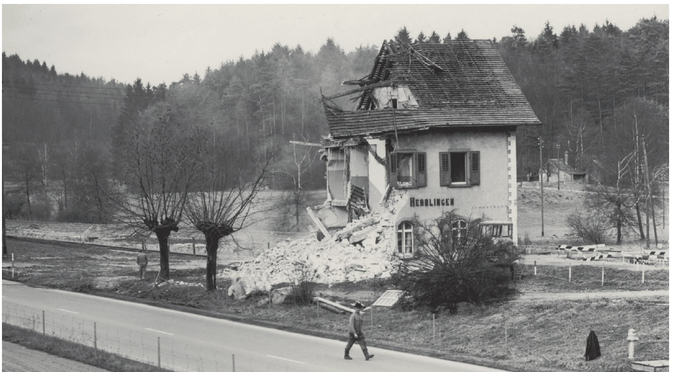
Abbruch des alten Bahnhofes Herblingen im Jahre 1968.

möglich ist. In den 38 Monaten Bauzeit wurden im Herblingertal rund elf Millionen Franken aufgewendet.