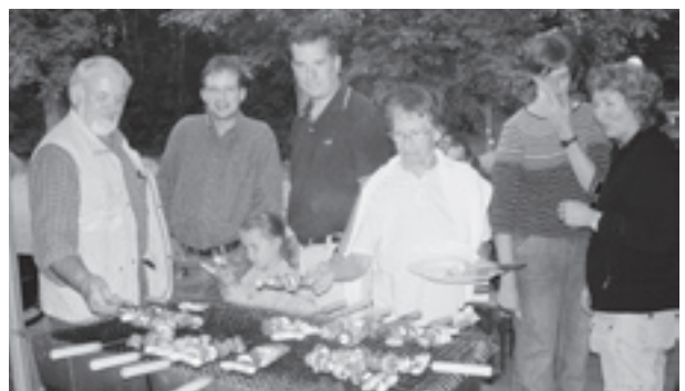
Gluschtige Spiesse durften sich alle nach Lust und Laune selbst zusammenstellen.