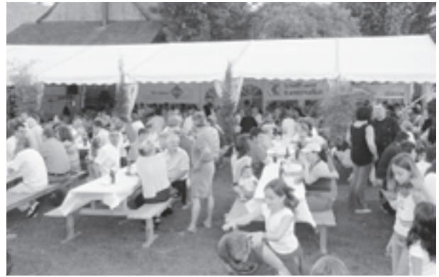
Die Chilbiwiese im Herzen von Herblingen mit der für den Durchgangsverkehr gesperrten Schlosstrasse ist ein idealer Ort der Begegnung.