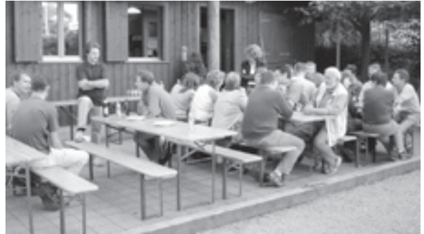
Als kleine Anerkennung für die vielen Arbeitseinsätze am Herblinger Dorffäscht und an der 1. August Feier auf dem Hohberg hat der Quartierverein bereits zum dritten Mal zu einem Helferfest eingeladen.