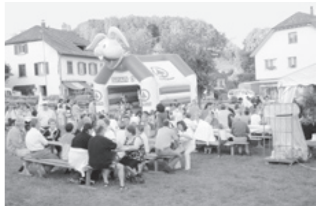
Last but not least sorgte der schöne Sommerabend für gute Stimmung auf dem Festplatz.