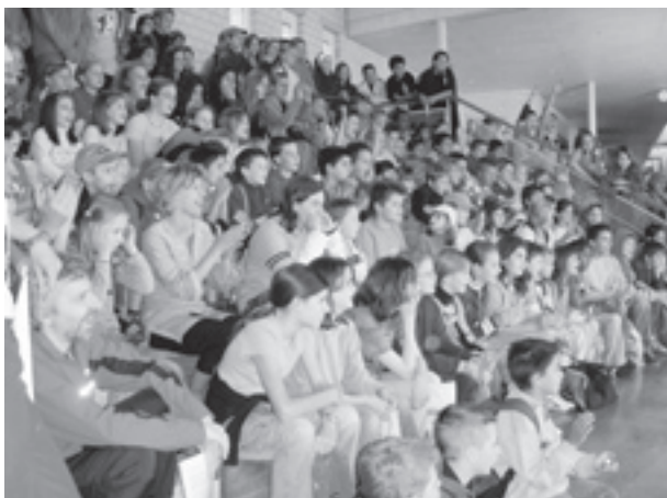
Eröffnung der Projektstage im Foyer des Schulhauses.