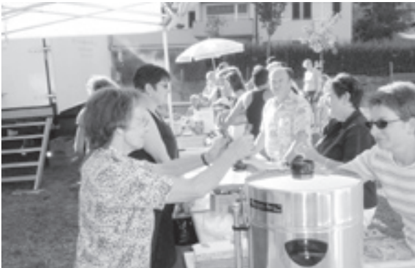
Die Helferinnen und Helfer in der Festwirtschaft hatten alle Hände voll zu tun...