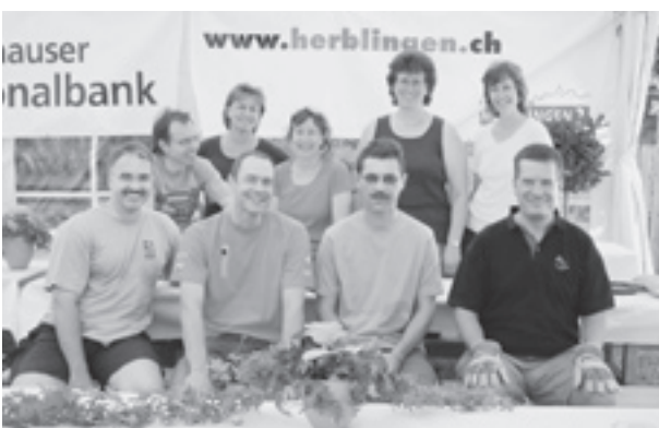
Der Aufbau ist geschafft - das Fest kann losgehen...