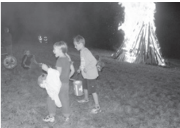
Was infolge der trockenen Witterung ennet dem Rhein verboten war, galt nicht für die 1. August-Feiern in der Stadt Schaffhausen: Auf dem Herblinger Hausberg durfte das traditionelle Höhenfeuer unter Aufsicht der Feuerwehr entfacht werden und auch das Abbrennen von Feuerwerk war an einem dafür abgesperrten Ort möglich.