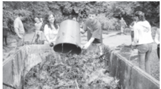
Für einmal wurde nicht die Schulbank gedrückt, sondern tatkräftig angepackt.