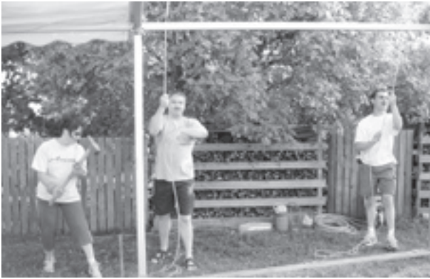
Beim Zeltaufbau waren viele starke Hände gefragt.