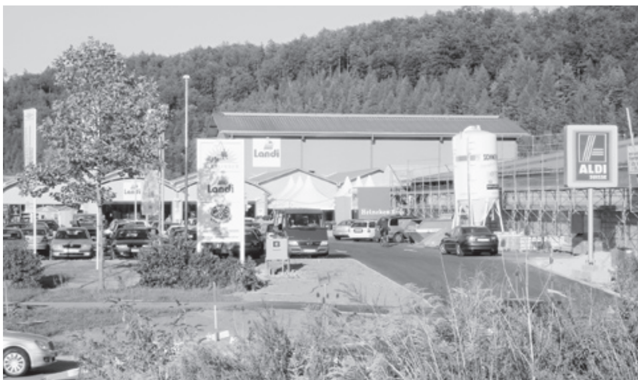
160 Gratis-Parkplätze stehen der Kundschaft beim neu eröffneten GVS Markt und der eingemieteten Filiale von ALDI Schweiz zur Verfügung.

Mehr zu all diesen Themen lesen Sie in der vorliegenden Ausgabe der Quartierzeitung Herblingen.