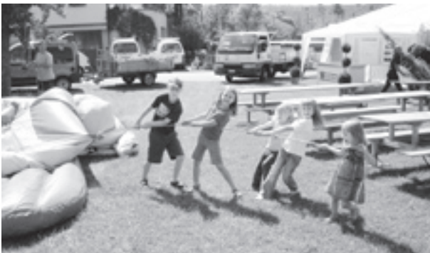
Keine(r) zu klein, ein tüchtiges Helferlein beim Aufbau der Hüpfburg zu sein.