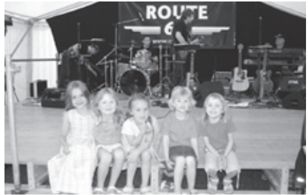
Route 6 begeisterte nicht nur die grossen, sondern auch die kleinen Musikfans.