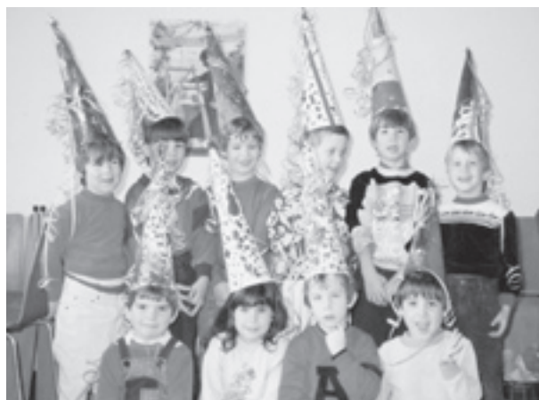
Spielgruppe Herblingen anno 1987...