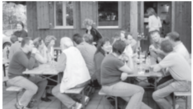
Geselliges Beisammensein der HelferInnen bei der Pétanque-Clubhütte im Dreispitz.