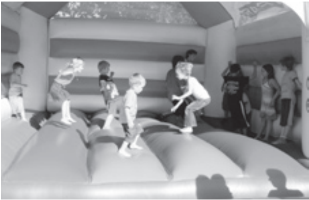
Die Hüpfburg war auch dieses Jahr ein Höhepunkt für die jungen Festbesucher.