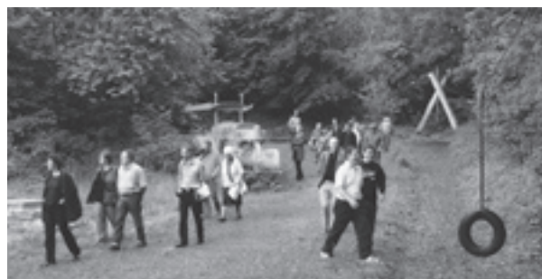
Besichtigung Freizeitanlage Dreispitz anlässlich des «Landschaftsarchitektur Mai» am 27. Mai 2006.

Die Veranstaltung «Gartenjahr 2006» hat zum Ziel, die breite Öffentlichkeit für die Pflege, die Weiterentwicklung und den Schutz des Kulturgutes Garten zu sensibilisieren. Getragen wird das Gartenjahr von folgenden Organisationen: BSLA (Bund Schweizer Landschaftsarchitekten und Landschaftsarchitektinnen), ICOMOS (Internationaler Rat für Denkmalpflege; International Council on Monuments and Sites), NIKE (Nationale Informationsstelle für Kulturgüter-Erhaltung), SHS (Schweizer Heimatschutz), PP (Schweizerische Stiftung Pro Patria), VSD (Vereinigung der Schweizer Denkmalpfleger und Denkmalpflegerinnen). Diese Verbände haben während des gesamten Jahres 2006 eine Vielzahl von Veranstaltungen in der Schweiz organisiert. Die Veranstaltungen vermitteln einen Einblick in die Vielfalt, die Geschichte und Kultur und in die Bedeutung von Gärten und Grünanlagen im Wandel der Zeit.