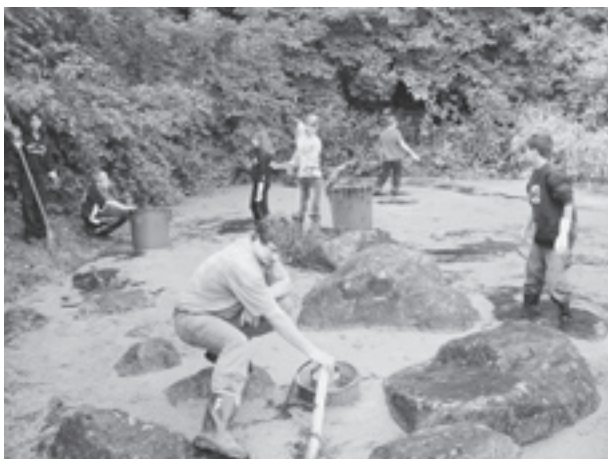
Im Teich wird das Wasser bis auf wenige Centimeter abgepumpt, um den Unrat auf dem Grund besser beseitigen zu können.

Zusammen mit den Vereinen der Freizeitanlage Dreispitz (Familiengärten, Kleintierzüchter, Freizeitwerkstatt, Tennis-, Pétanque- und Fussballclub) organisiert der Quartierverein jährlich einen Frühlingsputz der Robinsonspielplatzanlage im Dreispitz. Bei der diesjährigen Aktion am 18. April wurden Unrat entfernt, Spielgeräte und Treppen repariert und der Holzvorrat bei der Feuerstelle ergänzt.