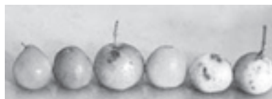
Früchte des Speierlings