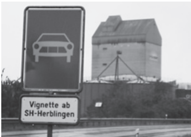
Diese Tafel verursacht einen Schleichverkehr durchs Quartier.

Die Vignettenpflicht ab Herblingen führt zu unnötigem Verkehr auf der Herblingerstrasse. Tagesausflügler, Rheinfalbesucher aber auch Pendler verlassen wegen der Vignettenpflicht ab Herblingen vorzeitig die Schnellstrasse.