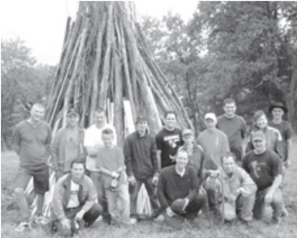
Dank vielen HelferInnen stehen das Höhenfeuer und die Festwirtschaft in wenigen Stunden bereit.