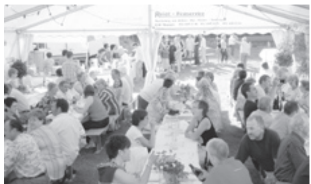
Die lange Vorbereitungszeit hat sich gelohnt: Trotz Fussball-WM war der Besucheraufmarsch erfreulich gross.