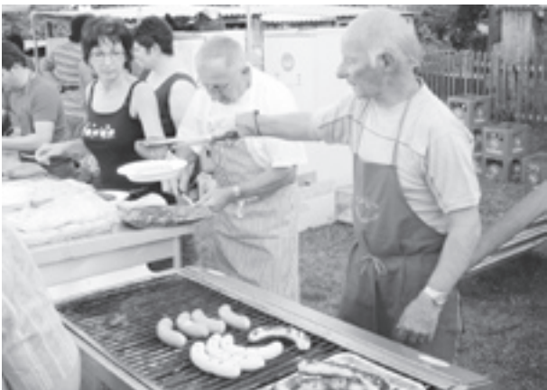
...und auch der Grill lief heiss.