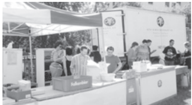
Helferinstruktion in der Festwirtschaft.