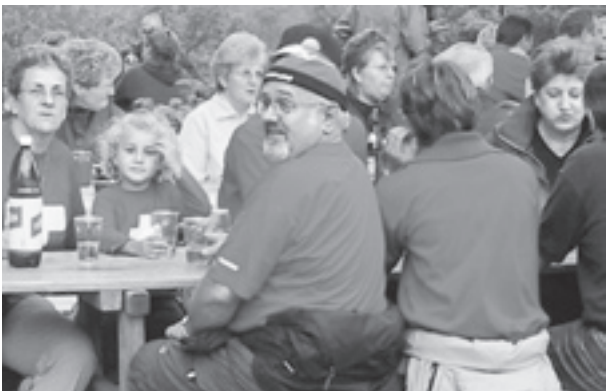
Dank Wetterglück am Abend genossen Gross und Klein das reichhaltige Angebot in der Festwirtschaft (erstmalig mit Steaks und Kartoffelsalat!) und die Aussicht zur Rheinfallbeleuchtung.