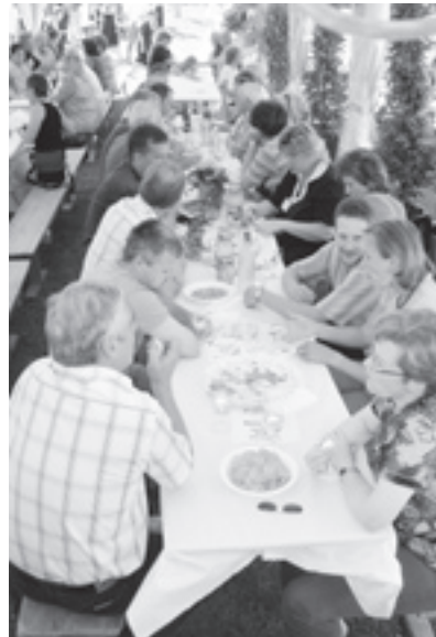
Sponsoren-Apéro: Ohne die Unterstützung durch Sponsoren wäre die Durchführung des Dorffäsches in dieser Form nicht möglich.