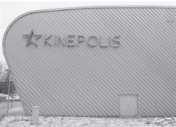
Multiplex-Kino an der Ebnatstrasse.

Der Stern, welchen wir in der letzten Ausgabe suchten, befindet sich am Gebäude unseres Multiplex-Kinos an der Ebnatstrasse. Nach einigen Höhen und Tiefen rund um den Bau wurde das Kinopolis am 15. Dezember 2000 eröffnet. Das Kinopolis bietet in acht Sälen über 1600 Sitzplätze an.