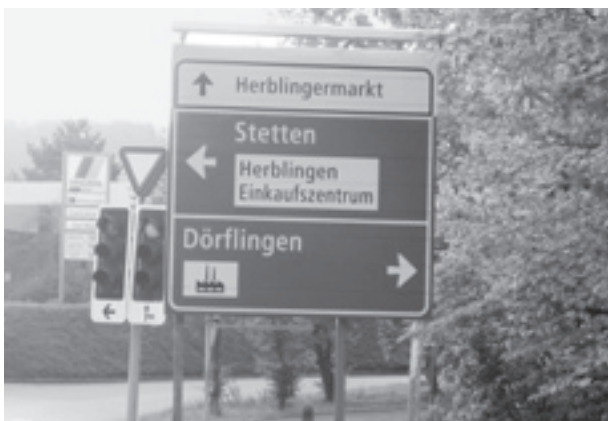
So mancher Tagestourist fragt sich: «Wo geht's denn hier zum Rheinfall?»

Fehlende Hinweise bei der Ausfahrt Herblingen lassen die Lenker darüber im Unklaren, in welcher Richtung es zum Rheinfall oder zum Stadtzentrum geht. Ab hier könnte der Ausweichverkehr durch das Industriegebiet geleitet werden.