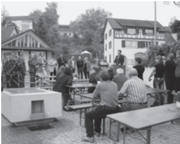
Zahlreiche Anwohner, Vertreter der Stadtbehörden und des Planungsforums sowie weitere Gäste folgten der Einladung des Stadtrates zur Eröffnungsfeier der Schlosstrasse.

Das Resultat darf sich sehen lassen. Zu den entscheidendsten Errungenschaften gehören sichere Fussgängerwege, neue Trottoirs, der Radstreifen sowie die eindeutige optische Aufwertung. Der ästhetische Brunnen beim Hirschenplatz stellt ebenfalls eine substantielle Bereicherung des Dorfbildes dar. Leider wurde die Offenlegung des Bachs ein «Opfer» des Kompromisses. Doch welches sind die Schattenseiten? Zahlreiche der rund 3500 Autofahrer, welche den Dorfkern täglich durchfahren, stören sich an den ungewohnten baulichen Verengungen der Strasse und den neu eingebauten, allerdings sehr flachen Schwellen, welche eine Temporeduktion erforderlich machen. Man kann sich fragen, ob dies wirklich so riesige Einschränkungen sind, wenn dadurch