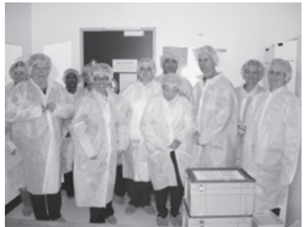
Von Kopf bis Fuss mit Schutzanzügen bekleidet starteten die Besucher in verschiedenen Gruppen den Rundgang durch die CILAG AG.