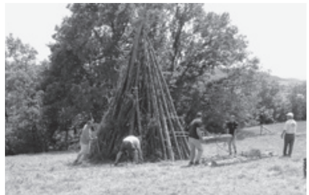
Am 1. August heisst es «kräftig zupacken»!