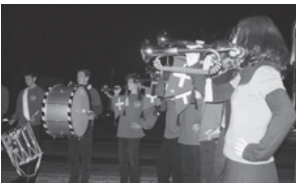
Die Clairongarde Schaffhausen spielte zu Ehren der Commercia.