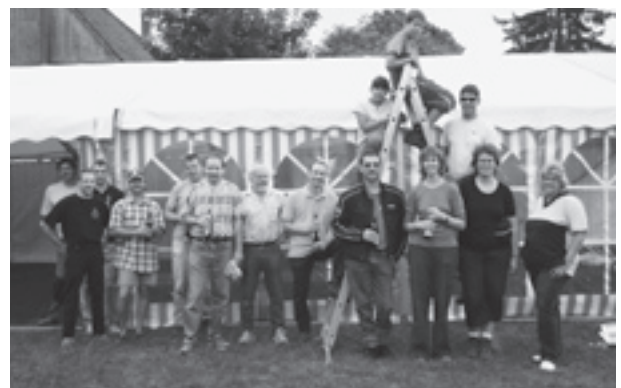
Der Auf- und Abbau des Festplatzes anlässlich des Dorffäsches sowie die Führung der Festwirtschaft erfordern besonders viele Helferinnen und Helfer.