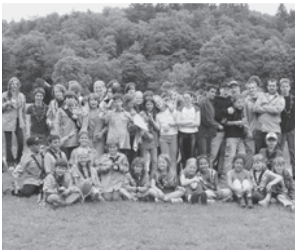
Quickfidel geht es zu und her bei der Pfadiabteilung Marsupilami – hier bei einem Abteilungs-Anlass.

Wenn in anderen Vereinen ältere Semester den Ton angeben, so sind es in der Pfadi die Jugendlichen selber, welche Verantwortung übernehmen. Dabei haben die Ältesten der Abteilungen nicht viel mehr als zwei Dutzend