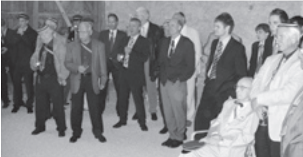
60 junge und erfahrene Kaufleute feierten ihr Stiftungsfest in Herblingen.

Am 25. Oktober 2005 führte die Schaffhauser Handelsschulverbindung der Kaufleute ihr jährliches Stiftungsfest in Herblingen durch. Von der über 100 Mitglieder zählenden Verbindung nahmen 60 Aktive und Altherren im Alter zwischen 17 und 91 Jahren teil.