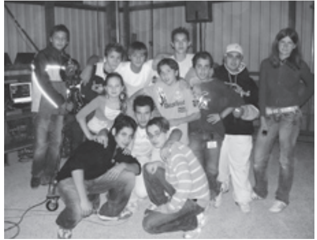
Jugendliche Fernsehcrew anlässlich ihres Live-Auftrittes im Brüll-TV-Studio.

Die JugendarbeiterInnen bekamen durch Brüll-TV Kontakt zu Jugendlichen und erste Schritte für eine längerfristige Beziehungsarbeit wurden realisiert. Die Beiträge der Jugendlichen haben konkrete Anliegen und Ideen für Projekte im Quartier zutage gebracht. So wird in Herblingen in Zusammenarbeit mit Jugendlichen dieses Jahr eine BMX-Bahn gebaut werden, und im Mai findet in Kooperation mit dem Schaffhauser Fernsehen ein weiteres Video-Projekt statt.