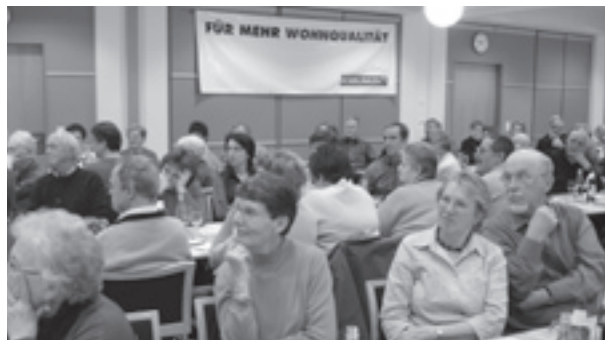
Die Versammlung nutzte das Podium, um verschiedene Anliegen und Fragen vorzubringen.

Die ordentlichen Traktanden konnten erwartungsgemäss zügig behandelt werden. Für einmal war der Präsident in der glücklichen Lage, dass sich der gesamte Vorstand für eine weitere Amtsperiode zur Verfügung stellt. Für einen