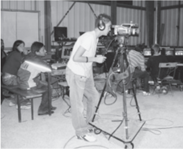
Hightech im mobilen Fernsehstudio im Dreispitz.

Teilnehmenden stammten aus der Siedlung Im Brüel (Neutalstrasse, Stüdiackerstrasse, Im Brüel) und waren ausländischer Herkunft.