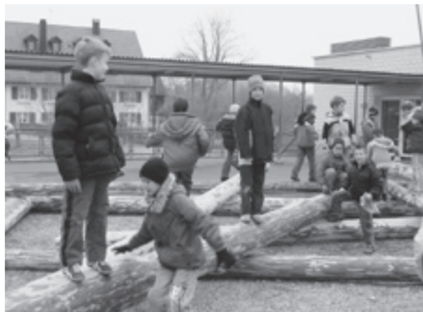
Riesen-Mikado beim Schulhaus Hohberg

In den Sportferien wurde das Riesen-Mikado auf dem Pausenplatz des Schulhauses Hohberg erneuert. Die alten, morsch gewordenen Baumstämme mussten ersetzt werden, um den Kindern weiterhin ein gefahrloses Herumklettern und Balancieren ermöglichen zu können. Die Stämme dienen den Schülern auch als Pausenbänkli zum Verzehren ihres Znünis.