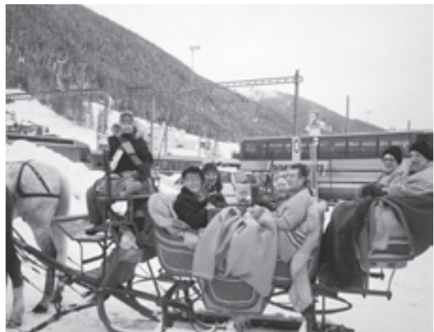
Die mitgereisten Spaziergänger nutzten den Ausflug für eine gemütliche Kutschenfahrt im Schnee.

Am Berchtoldstag startete eine fröhliche Schar mit dem Car zum Skiplausch nach Davos Parsenn. Unterwegs spendierte der Quartierverein zur Freude aller Teilnehmer Kaffee und Gipfeli. Leider war dann das Wetter auf der Piste windig und zum Teil recht stürmisch. Es fiel immer ein wenig Schnee, aber es fuhren trotzdem alle gern Ski, bis die Sicht schlechter wurde.