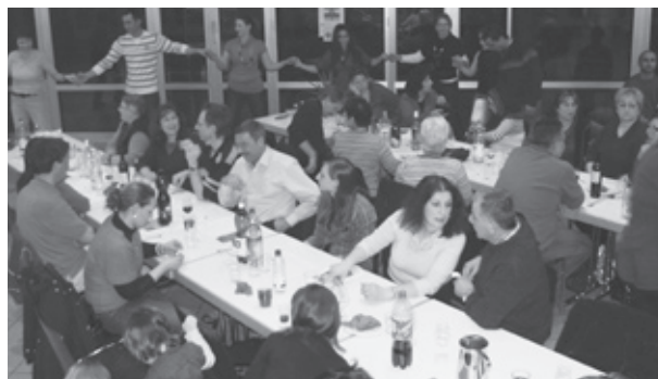
Der Abend war ein voller Erfolg

Die Deutschlerngruppe aus dem Balkan zauberte immer wieder neue Köstlichkeiten aufs Buffet. Allfällige Fragen zur Herstellung wurden beantwortet, zudem wurden einem die Rezepte präsentiert.