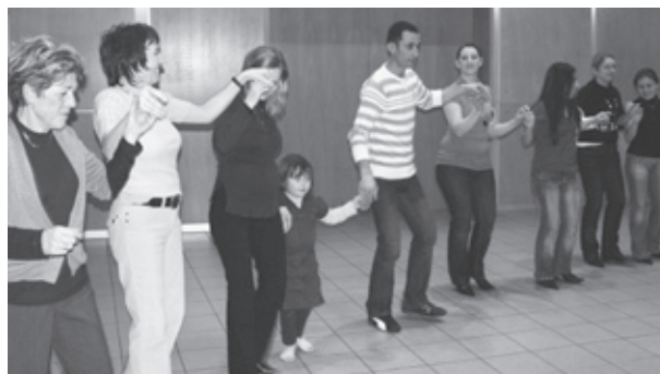
Es wurde neben dem feinen Essen auch getanzt