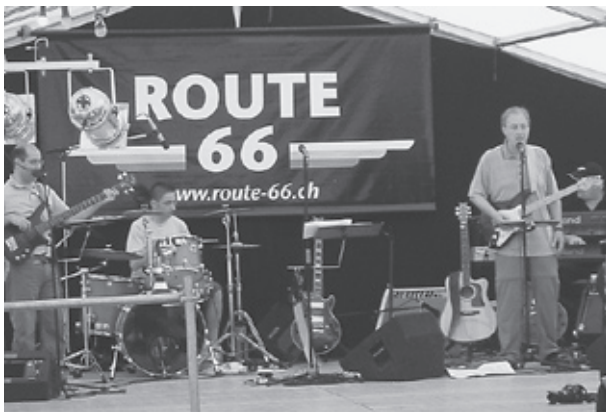
Das Dorffest darf man nicht verpassen

Das beliebte Dorffäscht gilt als Höhepunkt im Vereinsjahr und ist aus unserem Quartier- und Vereinsleben nicht mehr wegzudenken. Auch in diesem Frühling laden wir Sie und Ihre Familie herzlich zum gemütlichen Beisammensein ein. Treffen Sie Freunde, Nachbarn und Bekannte und geniessen Sie ein paar gesellige Stunden bei Musik, Tanz und gluschtiger Verpflegung aus unserer Festwirtschaft.