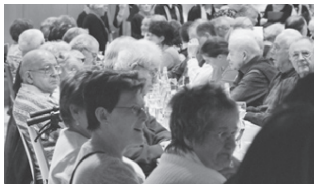
Gespannt lauschten die Mitglieder den Ausführungen...

Das Gespräch war sehr interessant und es zeigte sich, dass der Stadtpräsident und der Vorstand Eines gemeinsam haben: Beide setzen sich für eine gute Lebens- und Wohnqualität ein. Auf kommende Veränderungen im Quartier angesprochen, zeigte sich der Stadtpräsident offen und zuversichtlich. Wichtig sei ihm dabei, dass über Probleme diskutiert und konstruktive Gespräche unter den Beteiligten geführt werden. Es gefiel ihm sichtlich an unserer GV und er lobte auch das Wirken des Vorstandes für das Quartier.