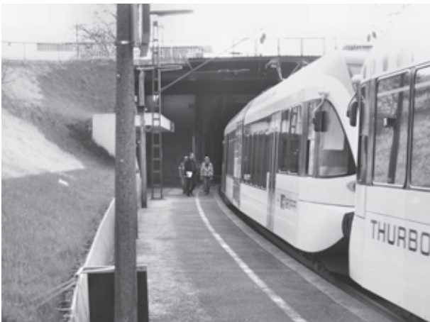
Die Bahnstation wird regelmässig benutzt.

Schon bald könnte nicht nur der Ball im Herblingertal rollen. Sollte das Stadion kommen, nimmt mit Sicherheit auch der öffentliche und individuelle Verkehr stark zu. Doch so oder so die Bahnstation Herblingen ist dringend sanierungsbedürftig. Im Moment ist die Station nur über je einen Abgang erreichbar und überhaupt nicht behinderten gerecht. Im Zuge des Stadionbaus soll die Station einen zusätzlichen Abgang erhalten und behinderten gerecht ausgebaut werden. Mit einer Auffrischung werden sicherlich auch wieder mehr Passagiere die Bahnstation benutzen. Bei einem Augenschein Mitte April, war aber doch ersichtlich, die Bahnstation Herblingen wird schon heute mehr benutzt als man denkt. Obwohl einladend sieht die Bahnstation nicht aus. Aber immerhin sind Kameras angebracht, womit man sich immerhin etwas sicherer fühlen kann.