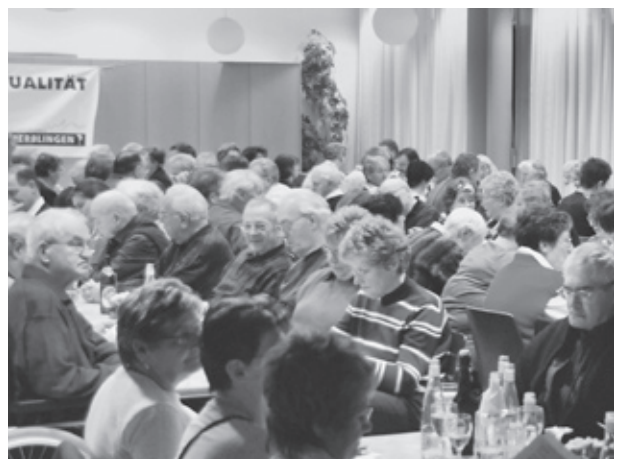
Im 2010 ist die Versammlung am Freitag 5. März