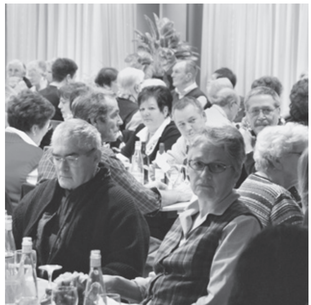
Viele Mitglieder sind schon seit Jahren im Quartierverein.