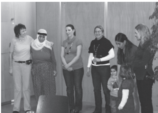
Das Kochteam am Balkan Kochabend

Danach wurden die anwesenden mit Köstlichkeiten aus der Region Balkan verwöhnt. Zum Beispiel mit Couscous, oder mit kroatischem Reis mit Wurst.