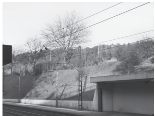
Im Hintergrund ist ersichtlich wo der FCS Park gebaut werden soll.