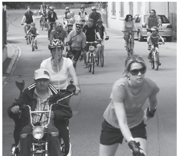
slowUp - der Langsamverkehr hat Vortritt!

Ein vergnügter Menschenstrom, bestehend aus Tausenden von Velofahrern, Inlineskatern und aus Hobbysportlern mit anderen, teils selbstgebauten Fahrzeugen wird an diesem Sonntag Herblingen beleben. Von der Fulach herkommend führt der 38 km lange Rundkurs via Schlosstrasse weiter zur alten Thyangerstrasse. Im Dorfkern lädt das Village Herblingen zum Rasten, zum Verpflegen und zum Verweilen ein. Der Quartierverein koordiniert auch dieses Jahr das Village. Er wird unterstützt durch die Damenriege, die Männerriege, und den CEVI. Jeder dieser vier Herblinger Vereine unterhält eine eigene Verpflegungsstation mit ausgedehntem Angebot. Vom frischen Birchermüesli, Pommes frites, Grilladen, Erdbeershake bis zu Kaffee und Kuchen bietet sich eine reichhaltige Auswahl um sich für die Weiterfahrt zu stärken. Selbstverständlich sind auch Zuschauer eingeladen, dem bunten Treiben beizuwohnen. Das grosse Festzelt bietet genügend Platz und Schutz vor Sonne oder allfälligem Regen.