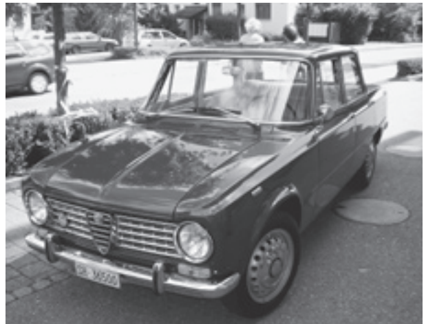
Einer der zahlreichen Oldtimer die im Einsatz standen.