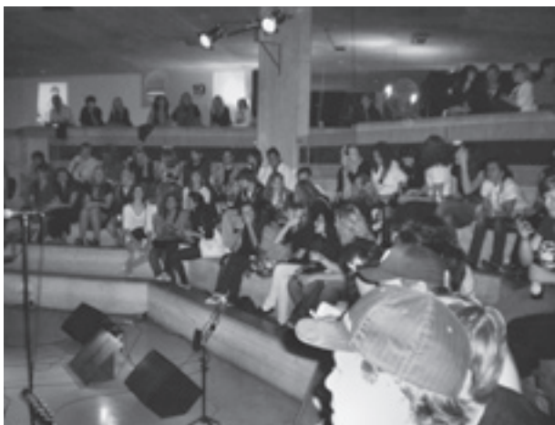
Schon lange vor den Konzerten war der Innenhof gut besetzt.

Je länger desto lauter – tatsächlich war es spannend zu erfahren, wie es sich mit der Akustik in dem Betonschulhaus mit dem hohen Lichthof verhielt. Egal auf welcher Etage man sich befand, die Stimmen der zahlreichen Gäste überschlugen sich nahezu. Eine Atmosphäre die seinesgleichen sucht – lebhaft und laut.