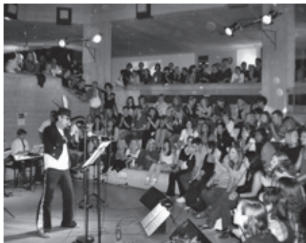
Die Lehrerband sorgte für beste Stimmung.