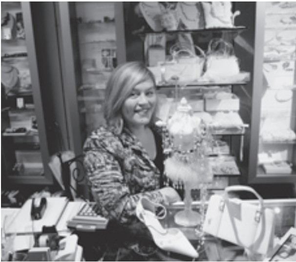
Cocktail-Abend und Hochzeitsmode für Sie und Ihn mit den passenden Accessoires (Schmuck, Taschen, Ringkissen, Fliege, Haarschmuck, und und und...)

Gk: Welchen Fauxpas kann man bei Brautkleidern machen?