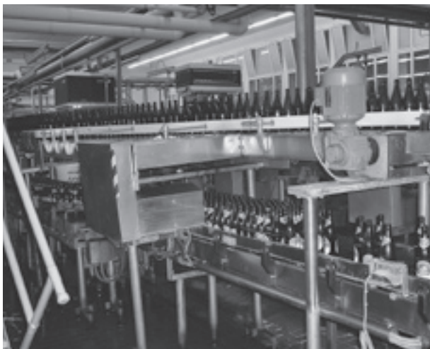
24'000 Flaschen können pro Stunde befüllt werden.

Der Jubiläumsanlass war mit einem Tag der offenen Tür gestaltet. Auf dem Rundgang durch die Bierproduktion wurde den Gästen die Geschichte der heutigen Brauerei näher gebracht. Wussten Sie, dass die erste Hausbrauerei 1644 in Schaffhausen an der Webergasse gegründet wurde und 1799 alt-Ratsherr und Küfer Bernhard Fischer im Wirtshaus «zum Zedernbaum» mit der gewerblichen Braukunst begann. Das Bier wurde im heutigen Restaurant Falken in der Altstadt gezapft. Daher stammt der Name Falkenbier.