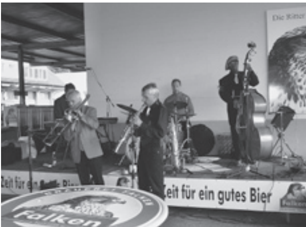
Die Scafusia Jazzband sorgte für gute Stimmung.