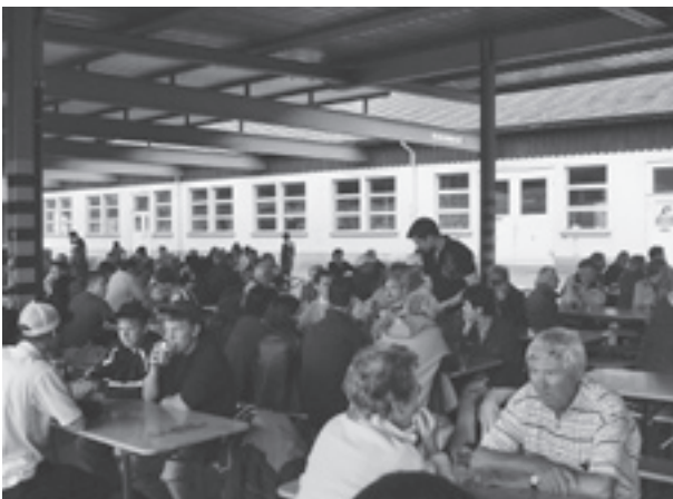
2'500 Besucher besichtigten die Brauerei Falken.