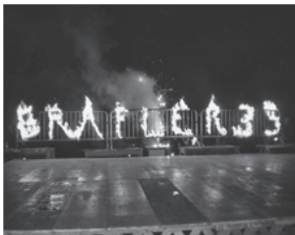
Schlussbild der Feuer Vorführung mit der Schrift «Gräfler 35 Jahre».