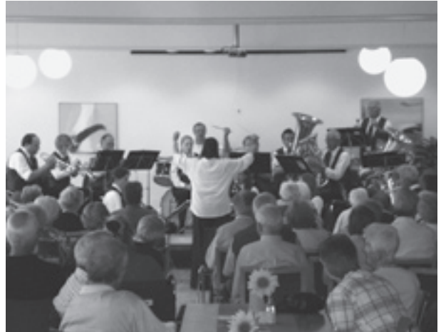
Der Musikverein Merishausen sorgte für Unterhaltung.

Auch die angebotenen Oldtimerfahrten waren beliebt, sowie die zahlreichen kulinarischen Höhepunkte der Bistro- und Küchencrew.