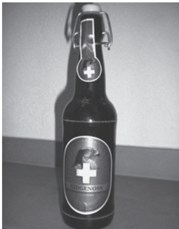
Das Eidgenoss: Nicht nur am 1. August beliebt.