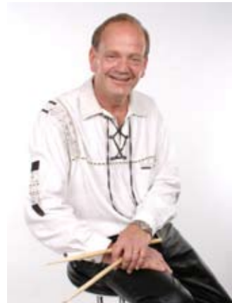
Mehr zu den Romanos unter: www.romanos.ch

H.M.: Nein. Zum Leidwesen meiner Frau bin ich kein besonders guter Tänzer. Zu meiner Entschuldigung möchte ich aber erwähnen, dass ich als Musiker nur selten dazu komme.