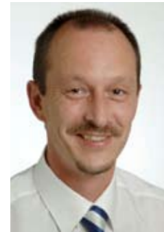
CEO Kreuzgarage Schaffhausen AG

Die Kreuzgarage Schaffhausen AG ist eine der ältesten Garagen in der Ostschweiz. Der Garagenbetrieb an der Schweizersbildstrasse 61 führt die beiden Marken Mercedes-Benz und Smart. Bereits seit 1956 führt das Unternehmen die Marke Mercedes-Benz. Die Garage bietet einen umfassenden Service im Verkauf, Leasing, Finanzierungen, Service und Reparaturen bei sämtlichen Marken. Das Unternehmen bittet diverse weitere Dienstleistungen an, z.B. das Pneuhotel, oder eine der modernsten Textilwaschanlagen, welche 24 Stunden geöffnet ist. Ebenfalls rund um die Uhr ist die AVIA Tankstelle direkt an der Schweizersbildstrasse geöffnet. Zusätzlich verfügt die Kreuzgarage über eine zertifizierte Spenglerei/Lackiererei.