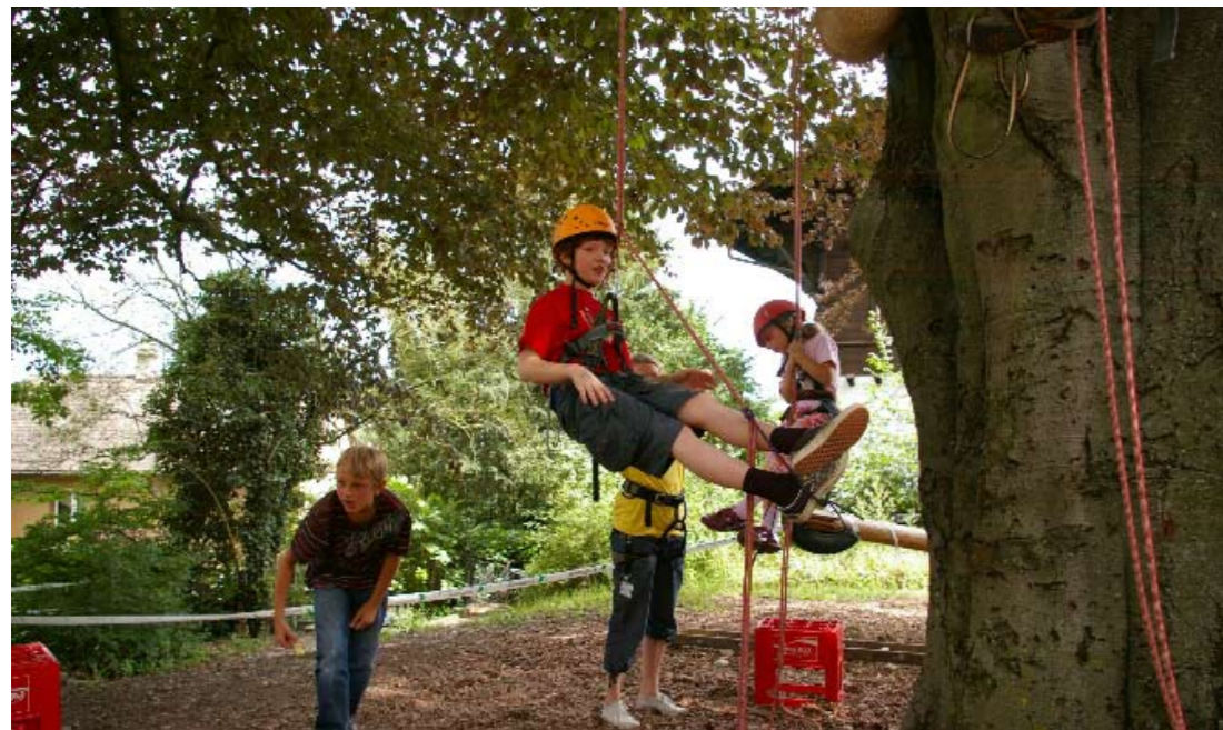
Kletterspass mit vielen anderen Kindern im Sommercamp von Snäck.