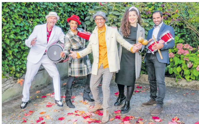
Karibische Klänge lassen Ferienstimmung aufkommen und animieren dazu, das Tanzbein zu schwingen.