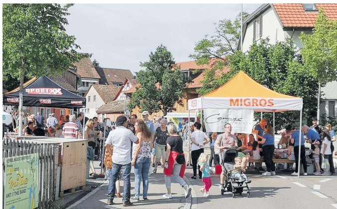
Insbesondere Familien kommen mit dem Samstagnachmittag-Programm voll auf ihre Kosten.